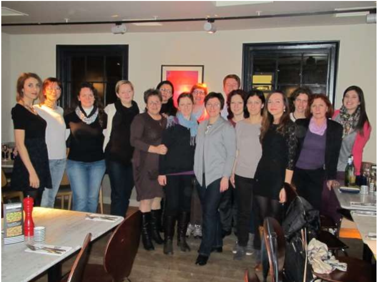
Profesori na okupu