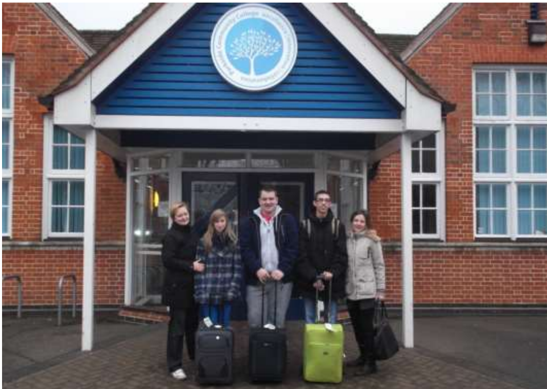
Naša ekipa ispred njihove škole...