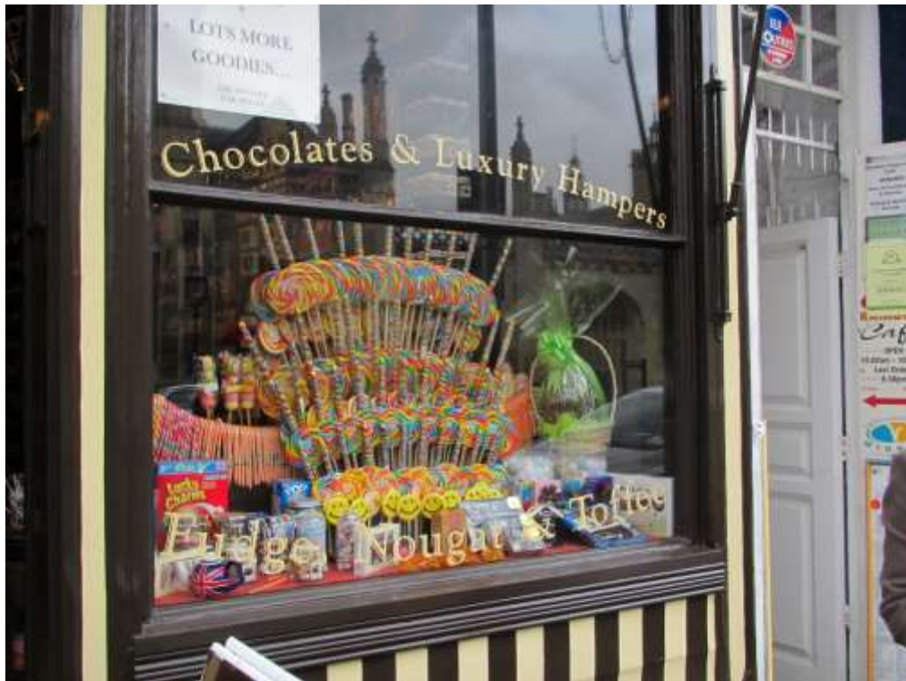
Prekrasno uređeni izlozi