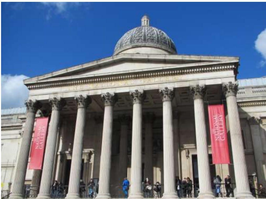
The National Gallery