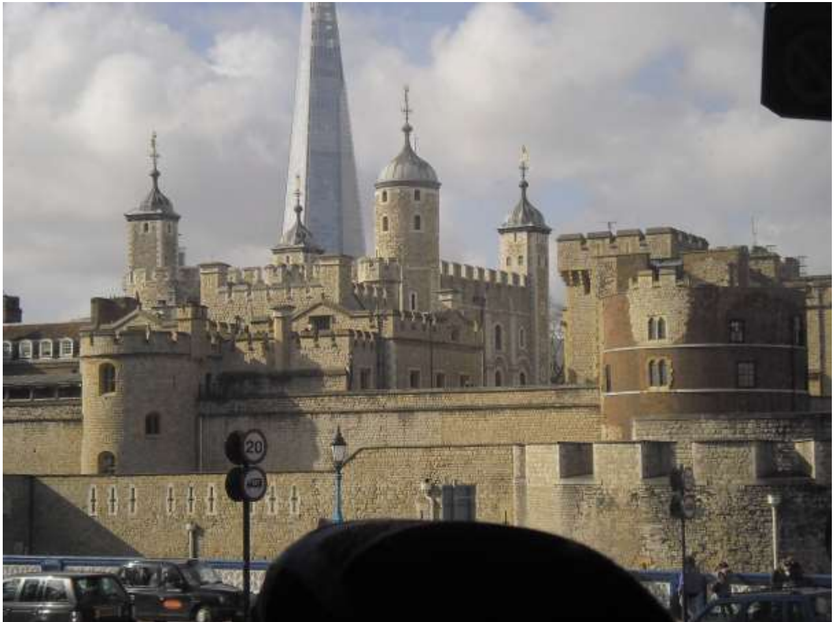
Houses of parliament