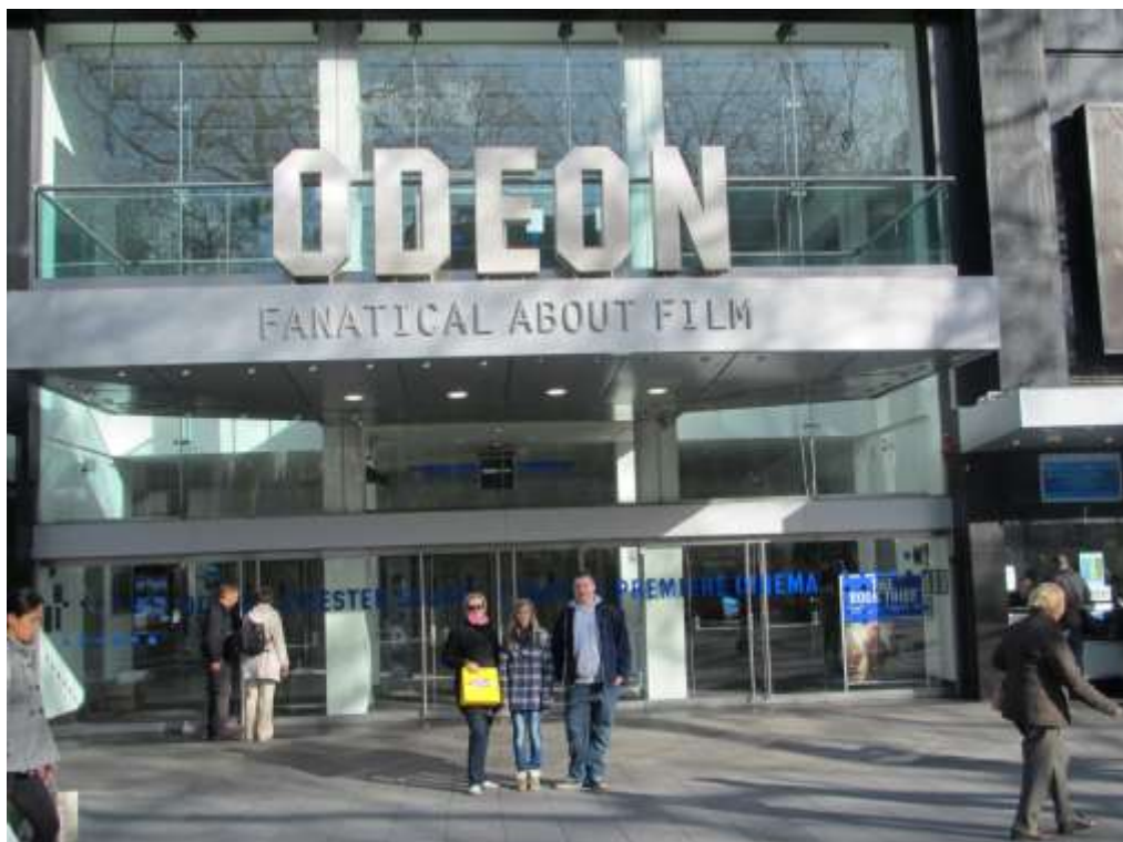
Kino Odeon – poznato po svjetskim promocijama filmova