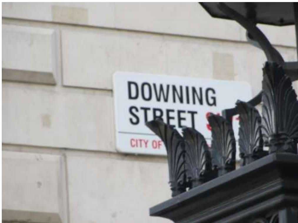
Vjerojatno najpoznatija adresa u Velikoj Britaniji je upravo 10 Downing Street – dom britanskog premijera.