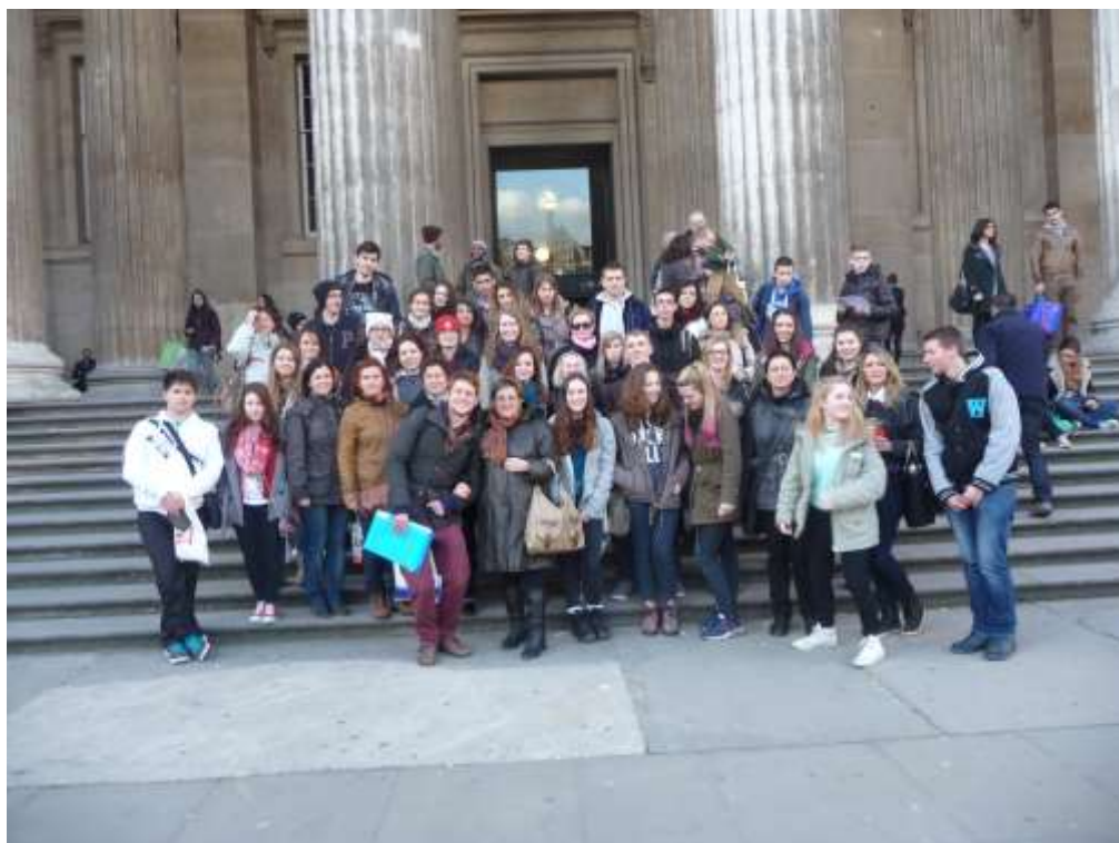
Zajednička fotka ispred The British museum-a